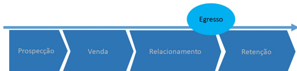
Figura 1: Ciclo de vida do acadêmico

Ciclo de vida do acadêmico e pesquisas: a UNIASSELVI faz consideráveis investimentos em pesquisas de mercado e mapeamento do ciclo de vida de seus acadêmicos (Figura 1), desde o momento em que são candidatos, durante todo o desenvolvimento de seu curso superior e após sua formatura, visando, dentre outras questões, compreender quais são as melhores políticas de integração da instituição com os públicos que afetam a completa formação e satisfação de seus acadêmicos.